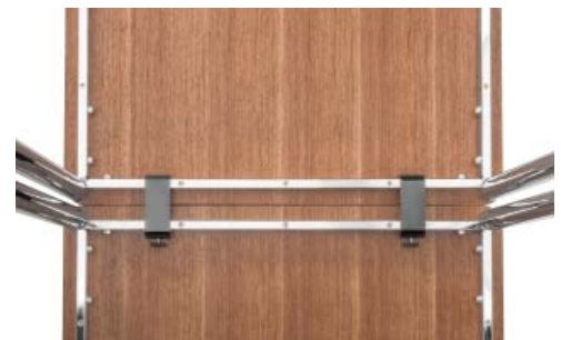
Élément de raccordement